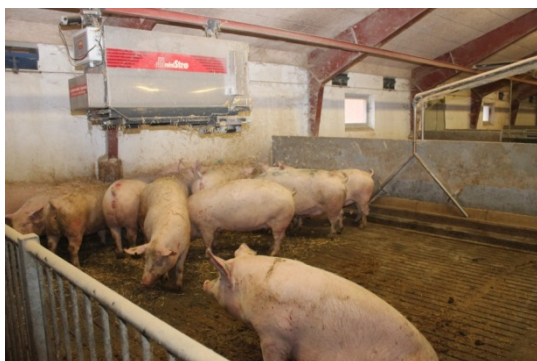
Figur 3. Drægtighedsstalden i besætning B var indrettet med vådfodring i langkrybbe (to krybber pr. sti). Søerne i kontrolgruppen fik tildelt halm på den faste gulv. Søerne i forsøgsgrupperne fik med samme strø-anlæg tildelt majsensilage på det faste gulv