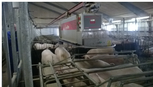
Foto 2. Halm og majsensilage blev tildelt via et strø-anlæg. Halmen blev placeret på det faste gulv udenfor boksene, mens majsensilagen blev tildelt umiddelbart bag søernes krybbe

Besætning B var på 1.100 årssøer. Søerne blev indsat i drægtighedsstalden fire uger efter løbning. Drægtighedsstalden var indrettet med fire rækker stier med fodring i langkrybbe (to krybber pr. sti). Der var 14 gylte eller 12 søer i hver sti. Søerne blev fodret med hjemmeblandet vådfoder to gange efter hinanden kl. 10:30 og 11:00 (55/45 %). Majsensilagen blev tildelt på det faste gulv i stien i en tilstræbt daglige mængde på 36 kg pr. sti og det blev tildelt ved to gennemkørsler af strømaskinen enten før eller efter tildeling af vådfoder.