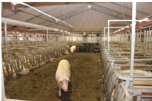
Foto 1. Drægtighedsstalden i besætning A var indrettet med æde-/hvilebokse (L-sti)