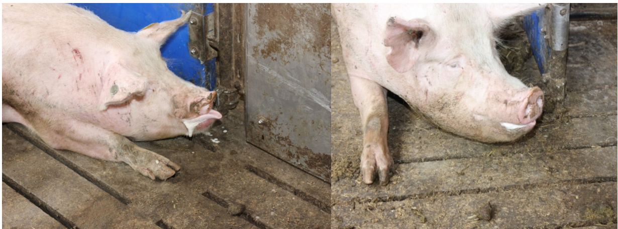
Foto 5 og 6. Eksempel på søer der ses tomgangstygge

Søer blev defineret som tomgangstyggere, når de havde hvidt skum omkring munden – se foto 5 og 6.